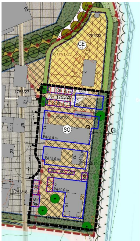
Überlagerung bestehender Bebauungsplan mit aktueller Planung, ohne Maßstab

Ausführliche Informationen zum Thema Schallschutz finden sich im 49-seitigen Immissionsschutztechnischen Gutachten, siehe Anlage. Hierin war der „Nachweis zu erbringen, dass die geplante Umwidmung einzelner Parzellen des Bebauungsplans "GE – Haselfurth" von einem Gewerbegebiet zu einem Sondergebiet bzw. der damit einhergehende Schutzanspruch der in dem Sondergebiet vermehrt möglichen Wohnnutzungen vor anlagenbedingten Geräuscheinwirkungen in keinem Konflikt mit den für die restlichen Parzellen des Gewerbegebietes als zulässig festgesetzten Flächenschalleistungspegeln bzw. Emissionskontingenten steht. [...]“. Die Wohnnutzung ist hierbei betriebsbezogen und ist in der textlichen Festsetzung 1.2 definiert. Umfangreiche Festsetzungen zum Schallschutz finden sich in den Planzeichen 6.4 und 6.5 sowie in den textlichen Festsetzungen unter 1.10.